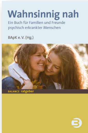
Wahnsinnig nah Ein Buch für Familien und Freunde psychisch erkrankter Menschen

Wer zum ersten Mal als Angehörige oder Freund mit einer psychischen Erkrankung konfrontiert ist, hat viele Fragen: Wie konnte es dazu kommen? Hätte ich mich mehr kümmern müssen? Was sagen die Freunde, was der Arbeitgeber? Muss ich jetzt die ganze Verantwortung übernehmen und wie lange soll das gehen? Wer unterstützt mich und wo finde ich verlässliche Informationen? In dem im Mai 2021 erschienenen Buch erzählen Mütter und Väter, Töchter und Söhne, Partnerinnen und Partner, Freundinnen und Freunde davon wie es gelingen kann, gemeinsam den oftmals schwierigen Alltag zu bewältigen. Neben den persönlichen Erfahrungsberichten bietet das Buch Informationen zu Diagnosen und Behandlungsmöglichkeiten, die eine erste Orientierung im Hinblick auf die Vielzahl psychosozialer, psychotherapeutischer und medizinischer Hilfeangebote geben. Tipps zur einer rücksichtsvollen Kommunikation und selbstverantwortlichen Achtsamkeit helfen, mit den Betroffenen in Kontakt zu bleiben und dabei die eigenen Bedürfnisse nicht aus den Augen zu verlieren.